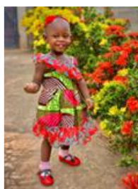
Gekleed om naar de kerk te gaan