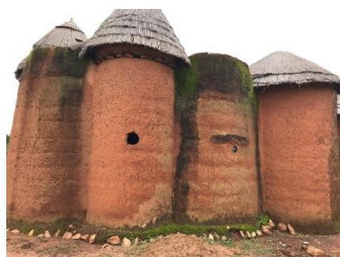
Een traditioneel huis

Voor vragen: stuur een mail naar info@beninami.nl