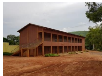
Een soortgelijk schoolgebouw